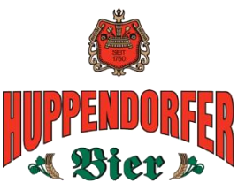
Huppendorfer Bier Huppendorf