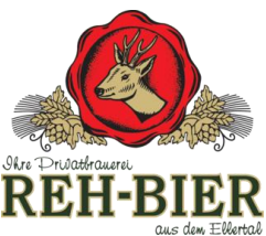
Privatbrauerei Reh Lohndorf